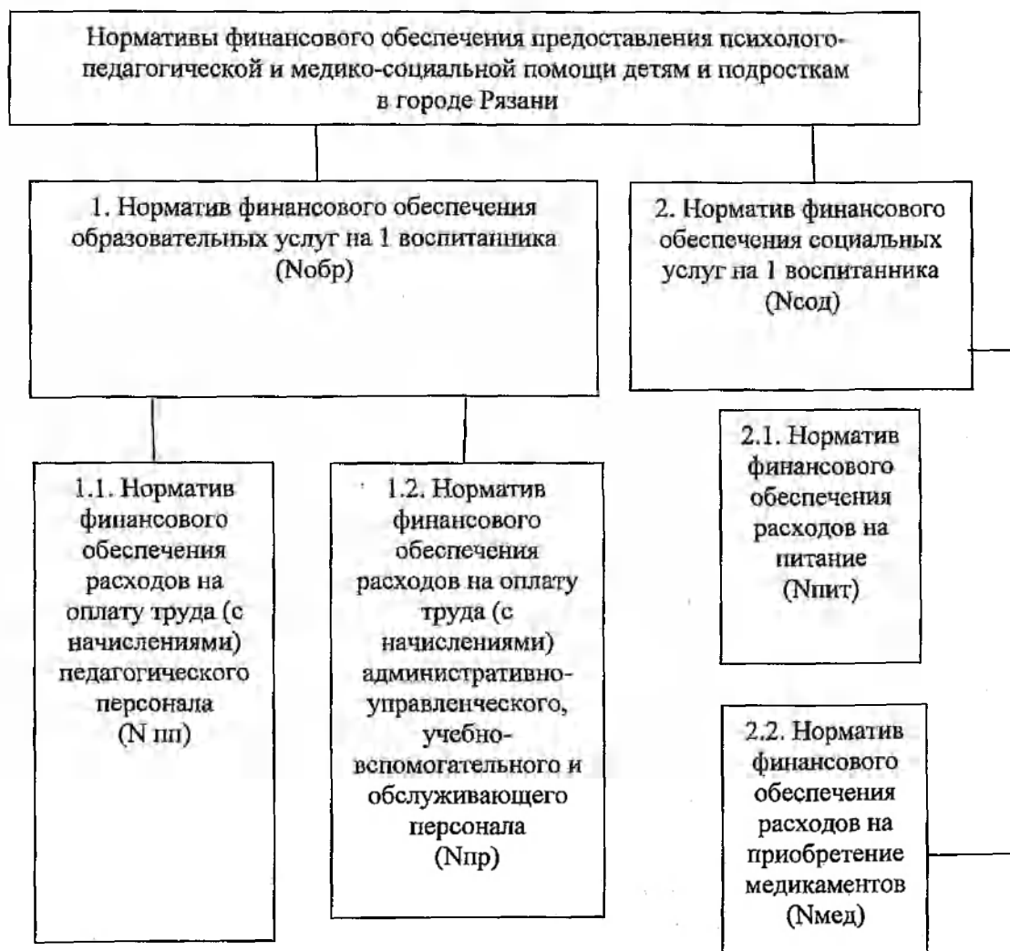
Схема расчета нормативов финансового обеспечения предоставления психолого-педагогической и медико-социальной помощи детям и подросткам в городе Рязани