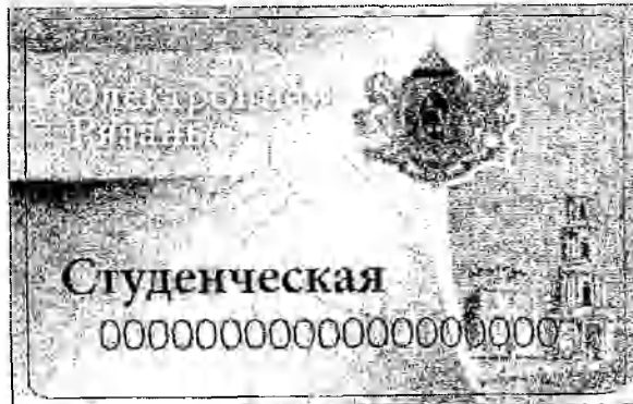
Лицевая сторона карты