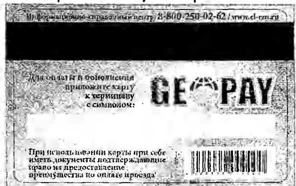
Оборотная сторона карты