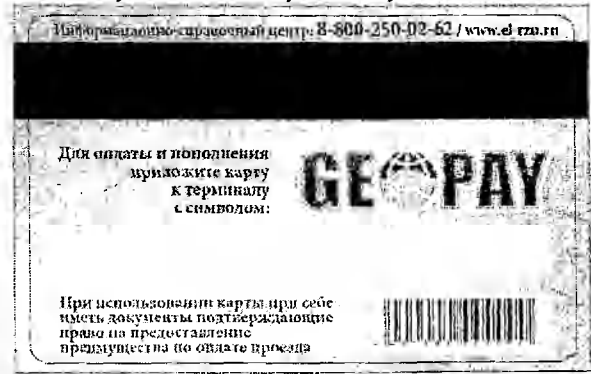
Оборотная сторона карты