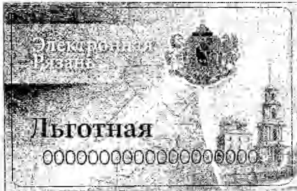
Лицевая сторона карты