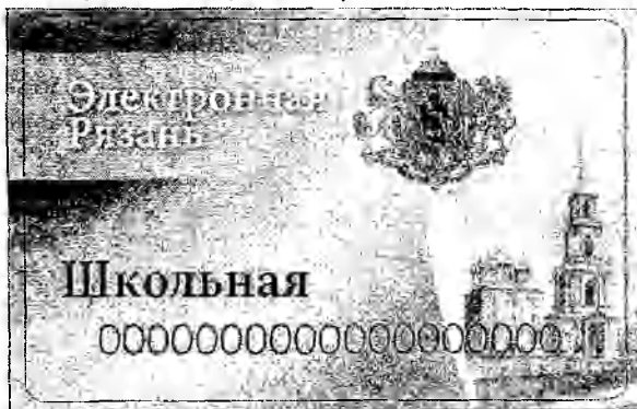
Лицевая сторона карты