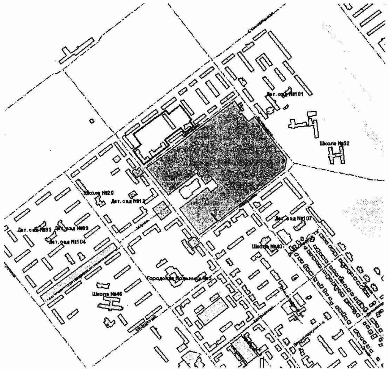
Схема расположения застроенной территории, подлежащей развитию

Приложение №1 к постановлению администрации города Рязани от 28 декабря 2011 № 5903